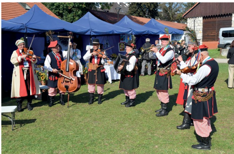
Uczestnicy konferencji mogli zobaczyć występy zespołów ludowych z Małopolski

dło informacji dla społeczeństwa i biznesu oraz mogą pełnić funkcję swoistych „przewodników” po dziedzictwie kulturowym obszarów wiejskich Małopolski. Podstawową funkcją katalogów, obejmującą warstwę dziedzictwa materialnego i niematerialnego, jest przechowywanie i udostępnianie map, materiałów tekstowych, wywiadów oraz materiałów obrazowych związanych z tym dziedzictwem. Ponadto katalogi mogą służyć jako materiał źródłowy przy opracowy-