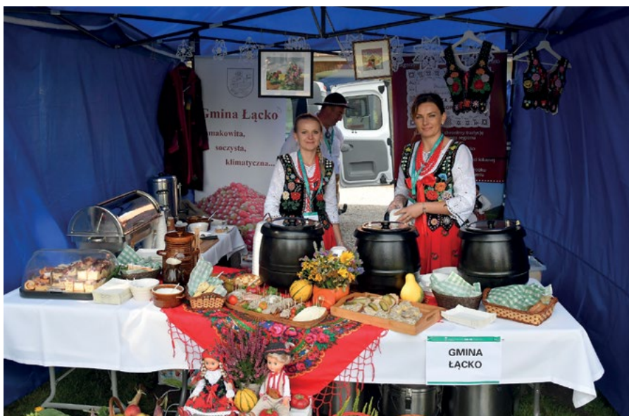
Panie z Koła Gospodyń Wiejskich w gminie Łącko prezentują lokalne przysmaki